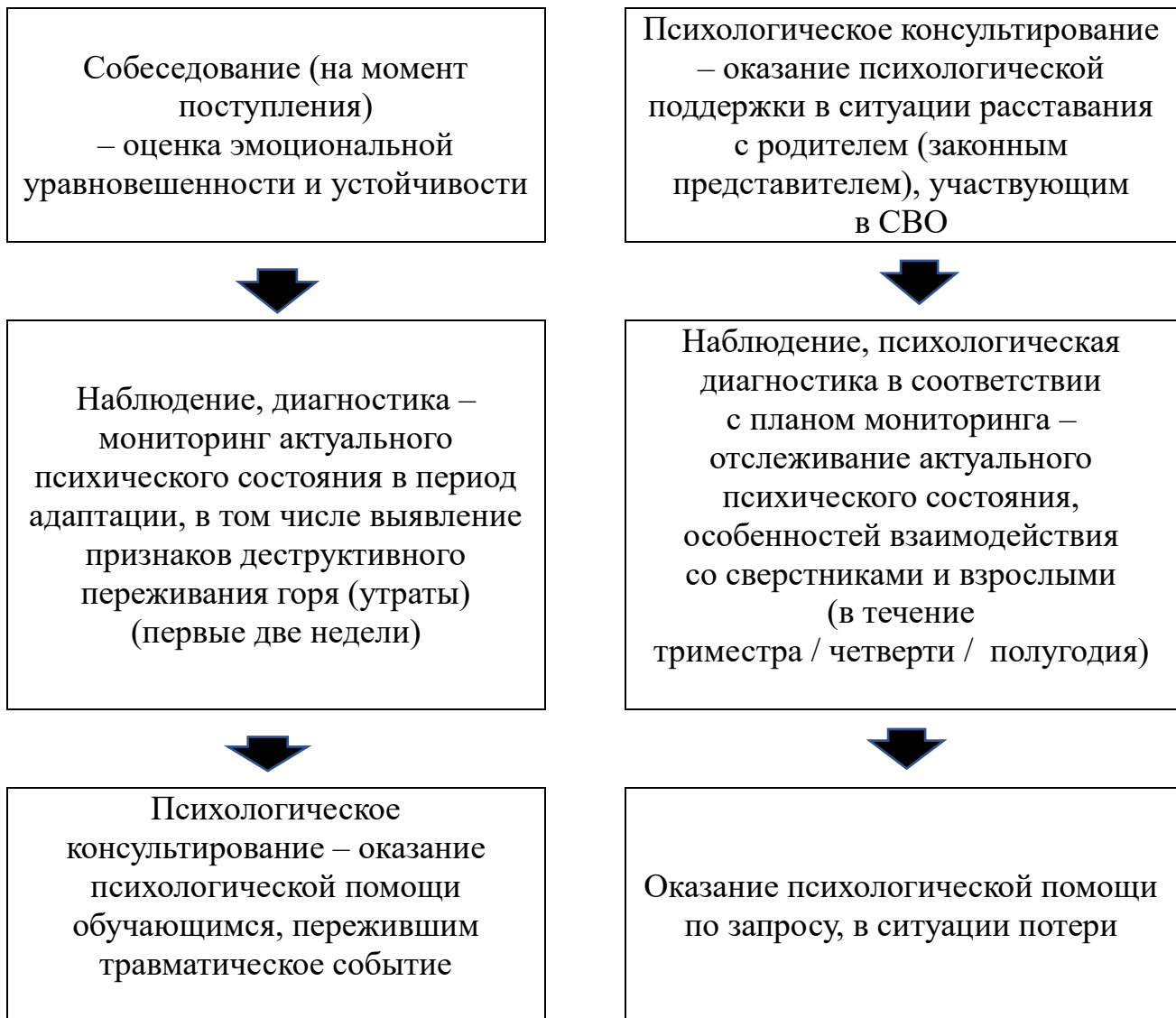
Схема выстраивания работы педагогов-психологов / психологов по психологическому сопровождению детей ветеранов (участников) СВО в зависимости от статуса пребывания обучающегося в образовательной организации

Каждое направление деятельности педагога-психолога / психолога включается в единый процесс сопровождения, обретая свою специфику, конкретное содержательное наполнение в форме программ адресной помощи (далее – психолого-педагогические программы) с учетом выявленных психолого-педагогических проблем, рисков и трудностей обучающихся целевой группы.